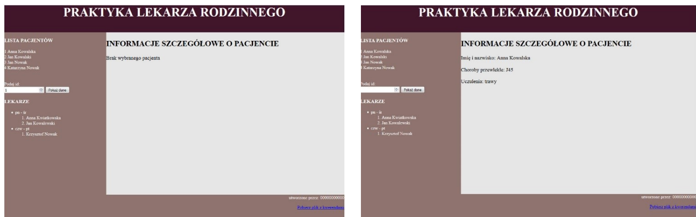
Obraz 2. Witryna internetowa. Strona przychodnia.php , pacjent.php