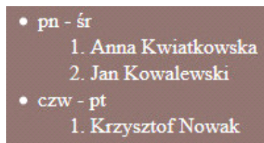
Obraz 3. Lista zagnieżdżona